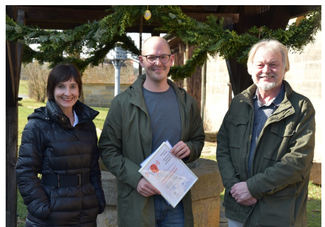
Museum für bäuerliche Arbeitsgeräte, Bayreuth