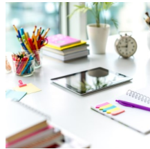
Termine und Veranstaltungen