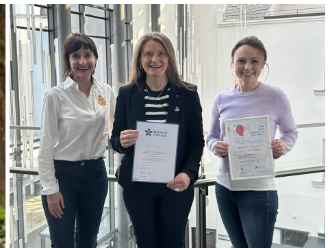
VHS Hofer Land