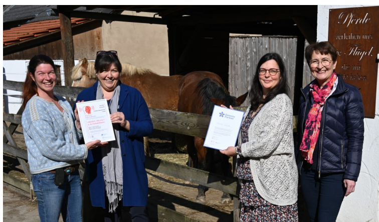
Erlebnisbauernhof Funk, Altendorf/Weismain