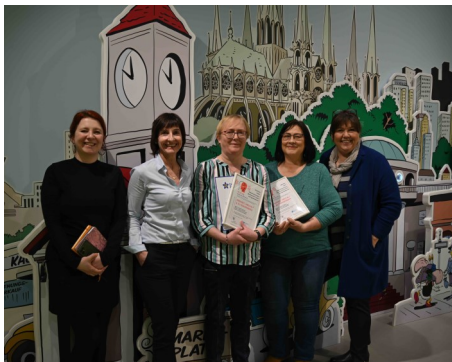
Erika Fuchs Haus, Museum für Comic und Sprachkunst, Schwarzenbach an der Saale

Im Nachgang besuchten die Mitarbeitenden des Curatoriums und der Fachstelle bereits fünf Einrichtungen, die den konkreten Start eines Projektes in naher Zukunft planen. Weitere folgen demnächst.