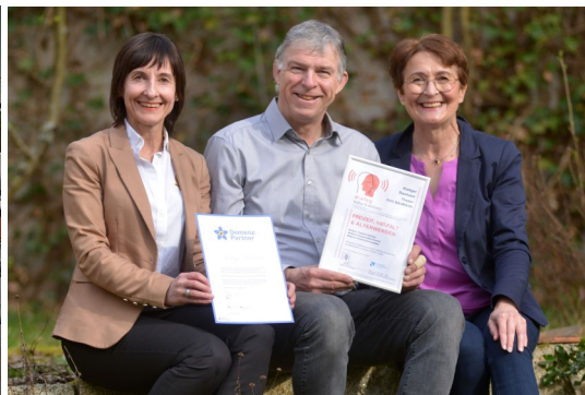
Das Baumann, Theater, Kulmbach