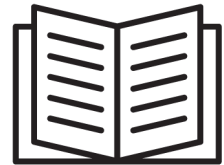
Informationen StMGP und LfP